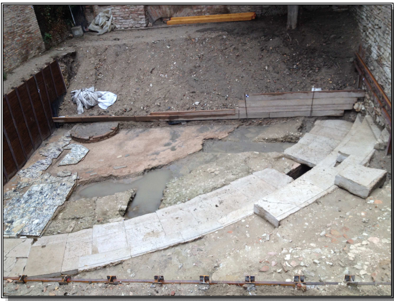
L'antico teatro romano della città di Urbino

L'apparato decorativo rinvenuto è riferibile a rifacimenti del II secolo d.C., mentre la struttura venne spoliata fra la fine del III e gli inizi del IV secolo d.C. ed i primi strati di accrescimento sono databili tra la fine del IV e gli inizi del V secolo d.C.