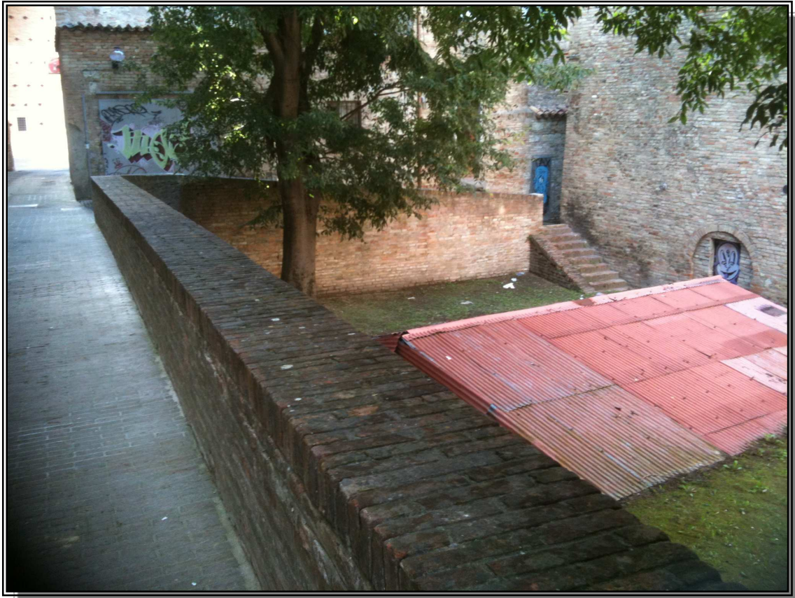
La tettoia di protezione installata negli anni '80 e rimasta sugli scavi fino all'avvio dei lavori di riqualificazione

Il progetto originario predisposto in seguito alla stipula di un ampio protocollo d'intesa fra Amministrazione Comunale, MIBACT – Soprintendenza Regionale; Università degli Studi di Urbino; Unione Montana Alta Valle del Metauro e Urbino Servizi e redatto dai tecnici del Comune di Urbino - Uffici UNESCO, Urbanistica e Lavori Pubblici, con l'ausilio dell'Università di Urbino – Scuola e Conservazione e Restauro dei Beni Culturali, che ha collaborato per le parti di rilevazione e valorizzazione della rete archeologica intercomunale, prevedeva il rilievo puntuale dei reperti archeologici ed il loro successivo reinterramento, con la valorizzazione ed il completamento dell'area verde sovrastante da effettuare con elementi di arredo urbano e sistemi informativi, al fine di illustrare agli utenti i ritrovamenti archeologici sottostanti e di rendere percepibile la forma del sottostante teatro.