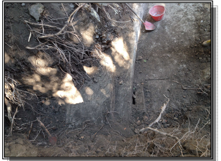
I lavori di scavo e consolidamento perimentrale

La porzione di Teatro Romano di Urbino emersa dagli scavi e gli studi condotti fanno supporre che la costruzione sia stata realizzata adattandosi alla naturale conformazione del terreno, presumibilmente nell'ambito di un vasto intervento urbanistico.