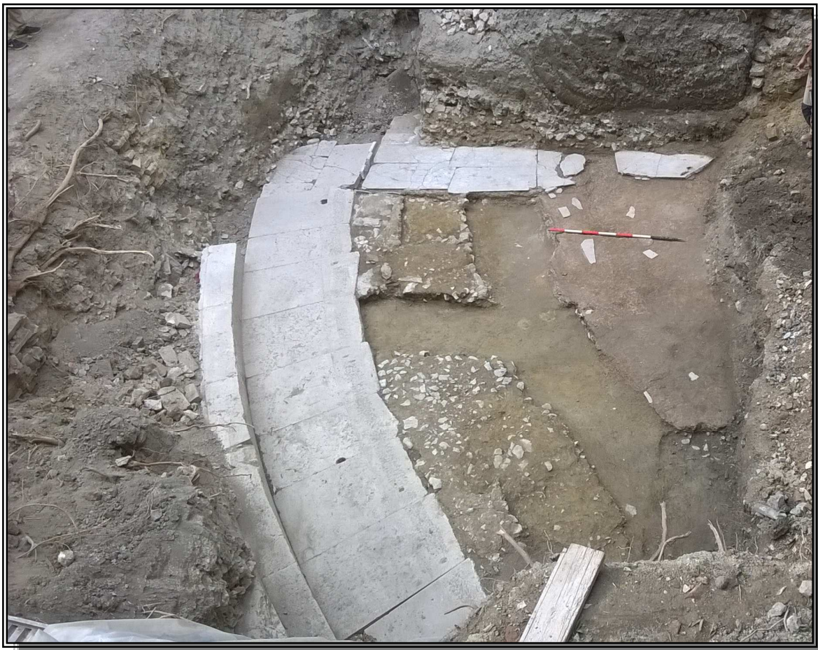
I reperti del Teatro durante gli scavi

La porzione di Teatro Romano di Urbino emersa dagli scavi e gli studi condotti fanno supporre che la costruzione sia stata realizzata adattandosi alla naturale conformazione del terreno, presumibilmente nell'ambito di un vasto intervento urbanistico.